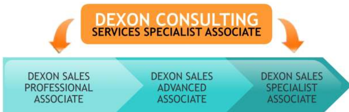
Esquema del Dexon Consulting Services Professional

Organizaciones que se encuentran dentro del sistema de Dexon sales Associate y ofrecen servicios de consultoría las cuales son afines a la implementación y utilización de nuestras soluciones y que obteniendo este sello puedan potencializar el desarrollo de su línea de negocio.